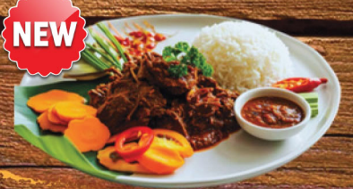
BEEF RANDANG لحم بقري رندانغ 65 ₪