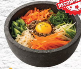
HOT STONE BIBIMBAB (TOFU OR BEEF OR CHICKEN) بيبيمباب بالحجر الساخن 65 ₪