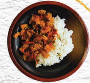
OJINGEO DUBBAB دوبياب الحبار 65 ₪