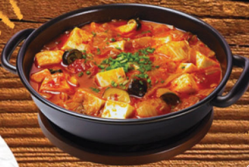
SUNTOFU JIKAE (SEAFOOD OR BEEF) بخنة سونتو فو 65 ₪