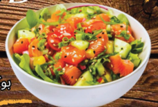
SALMON POKE & GOCHUJANG SAUCE بوكي سلمون مع صلصة غوتشوجانغ 69 ₪