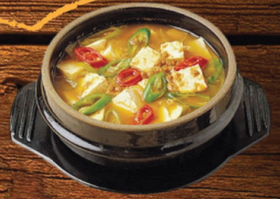
DUNJANGJIKAE بخنة دونججانغ (BEEF OR SEAFOOD) 65 ₪