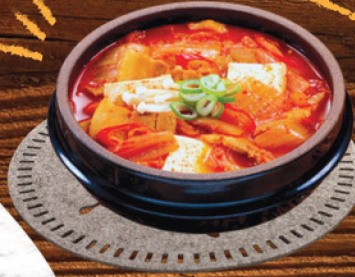
TUNA KIMCHIJKAE بخنة الكيمتشي بالتونة 65 ₪