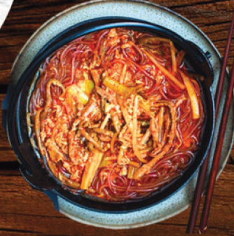
YUKKAEKANG KALKUKSU (SPICY BEEF NOODLE SOUP) كالوك سو يوكغايكانغ 69 ₪