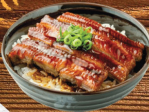
UNAKIDON أوناكيدون 69 ₪