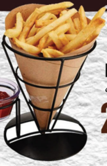
FRENCH FRIES بطاطس مقلية 25 ₪